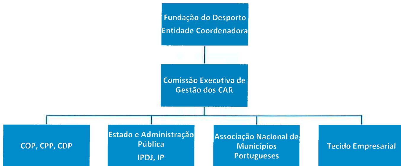
Fig. 2- Coordenação dos CAR na Fundação do Desporto.

A Rede Nacional de Centros de Alto Rendimento tem a seguinte constituição e valências: