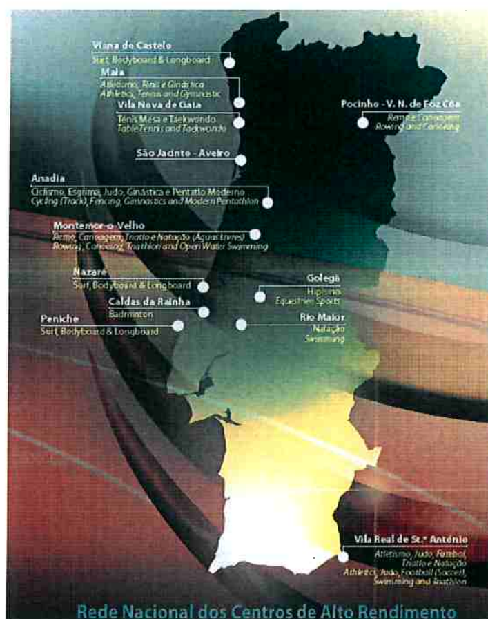
Fig. 3- Distribuição geográfica da Rede de Centros de Alto Rendimento.

A distribuição geográfica da Rede Nacional de Centros de Alto Rendimento é a que se segue: